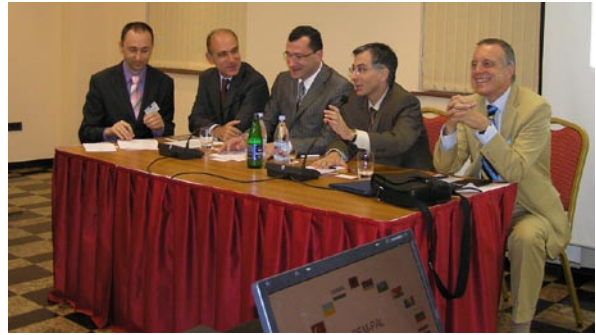
Приветствие и открытие, 21 октября 2009 г.