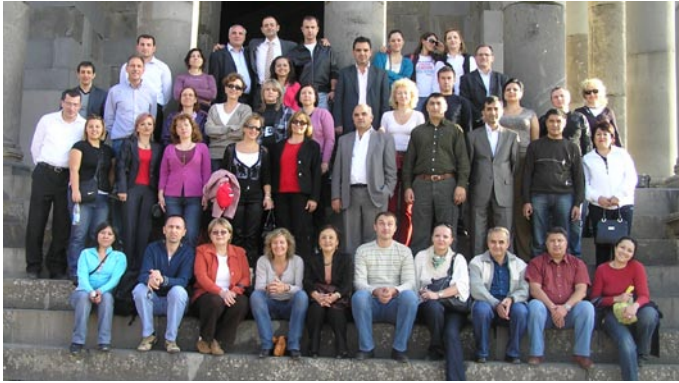
Фотография всех участников

Сообщество по взаимному изучению и обмену опытом в управлении государственными финансами (РЕМ-PAL) представляет многосторонние усилия, направленные на создание потенциала и обмен опытом в области реформ между странами Средней Азии и Центральной и Восточной Европы. РЕМ-PAL было инициировано в 2005 году в ответ на потребность усилить внутренний потенциал в области государственных расходов и управления финансами посредством коллегиального обучения и обмена информацией между практикующими специалистами из региона Восточной Европы и Средней Азии. РЕМ-PAL получил поддержку Всемирного банка, ОЭСР, Министерства Великобритании по международному развитию (DFID), Казначейства США, SECO, GTZ и InWEnt. Секретариат РЕМ-PAL отвечает за Центр по развитию финансов (CEF) в Любляне, Словения. Были сформированы три практикующих сообщества: для составления бюджетов, казначейства и внутреннего аудита, эти сообщества объединяют практикующих специалистов на самых высоких уровнях в этих конкретных областях государственных финансов. Более подробную информацию о РЕМ-PAL можно найти на веб-сайте РЕМ-PAL: www.pempal.org