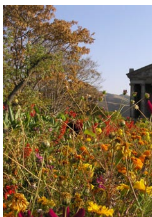
Храм Гарни, Армения

На третий день Даниэла Дэнеску представила новую модель зрелости потенциала для внутреннего аудита