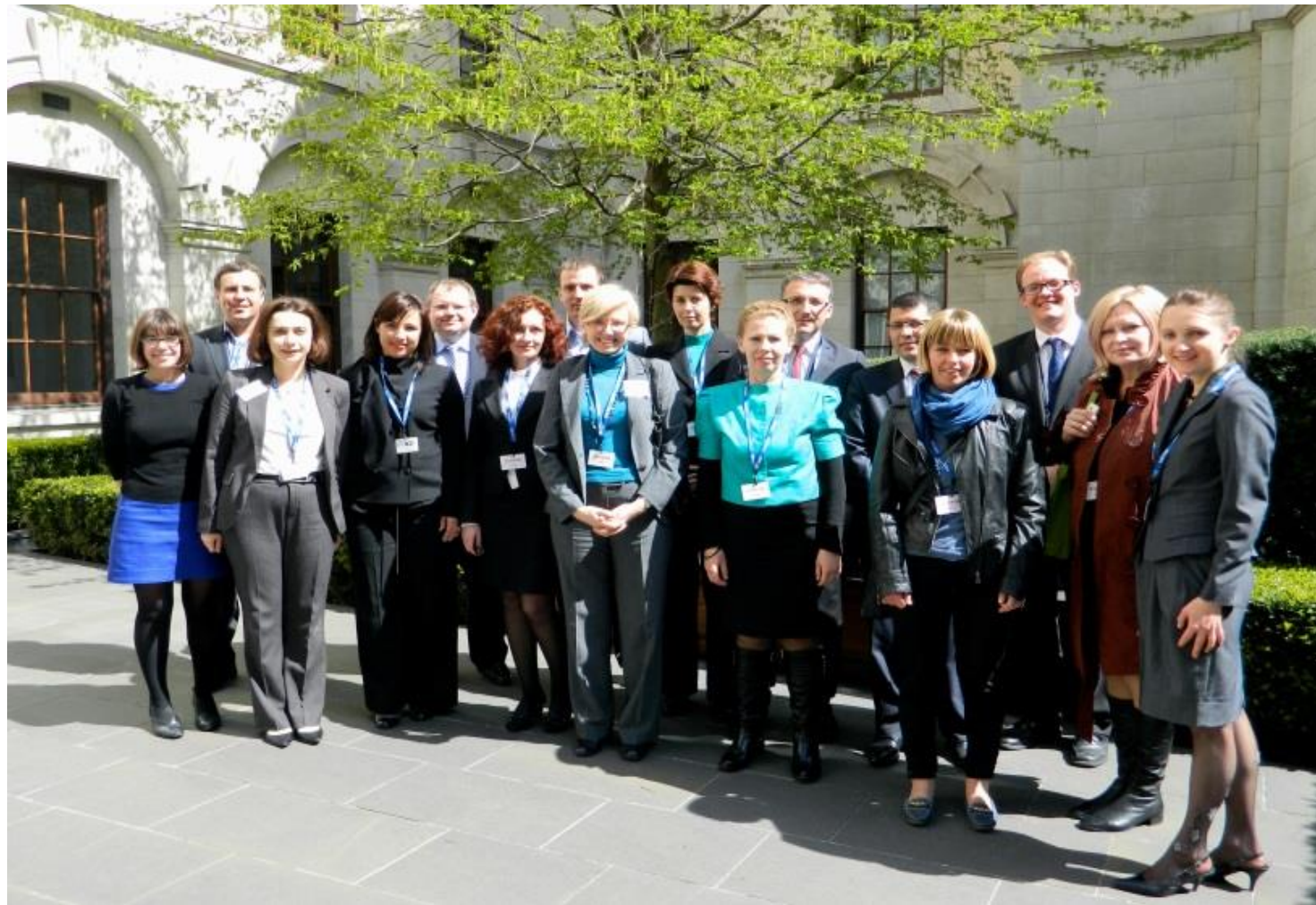
U Trezoru NJKV Ujedinjenog Kraljevstva – april 2013. godine