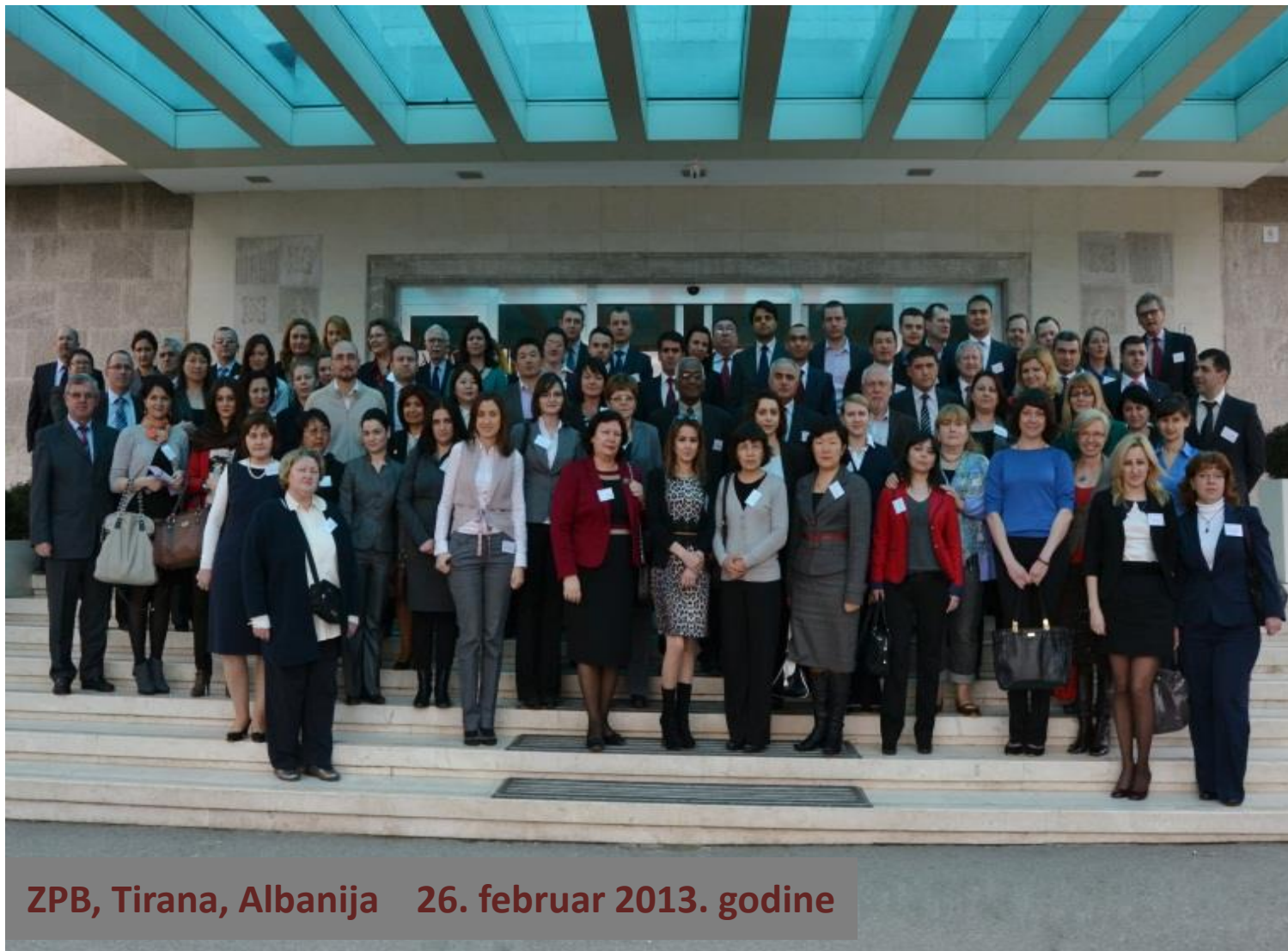
ZPB, Tirana, Albanija 26. februar 2013. godine