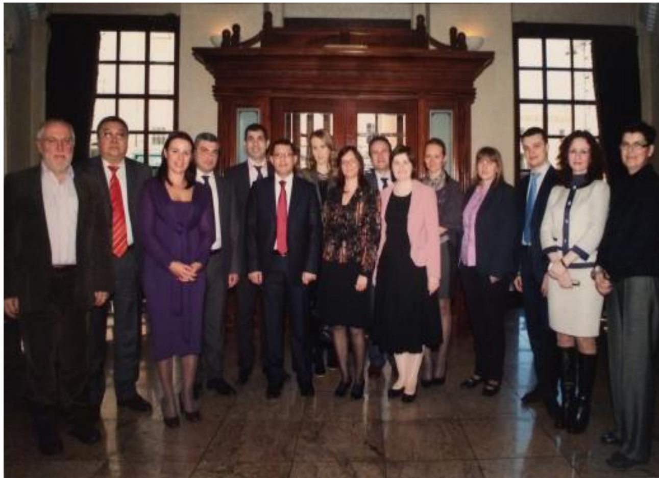
Dublin, Irska – novembar 2013. godine