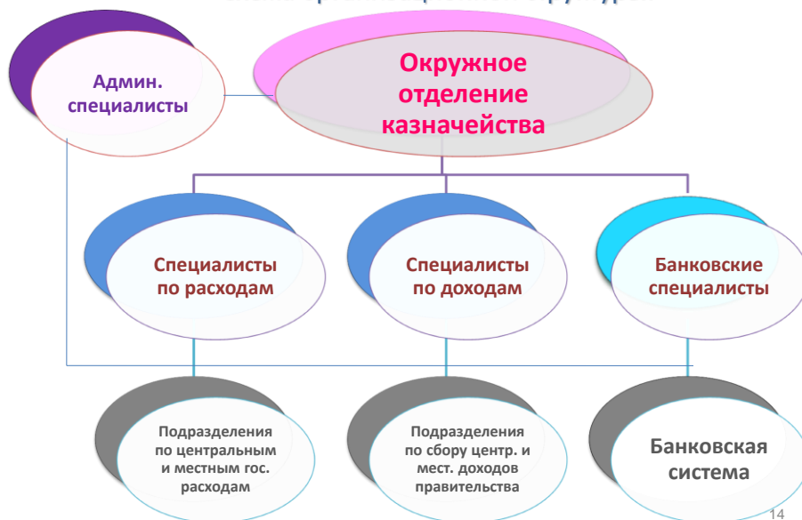
Схема организационной структуры: