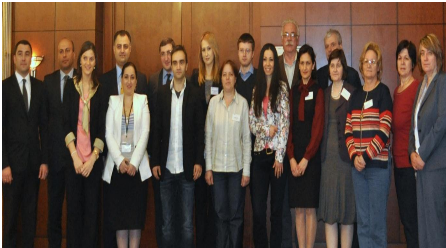
Учебная поездка в Минфин Грузии, апрель 2013 г.