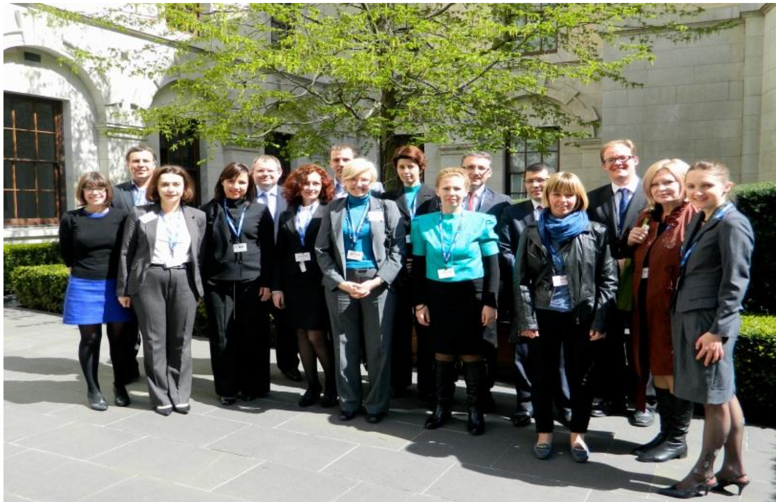
В Казначействе Великобритании, апрель 2013 г.