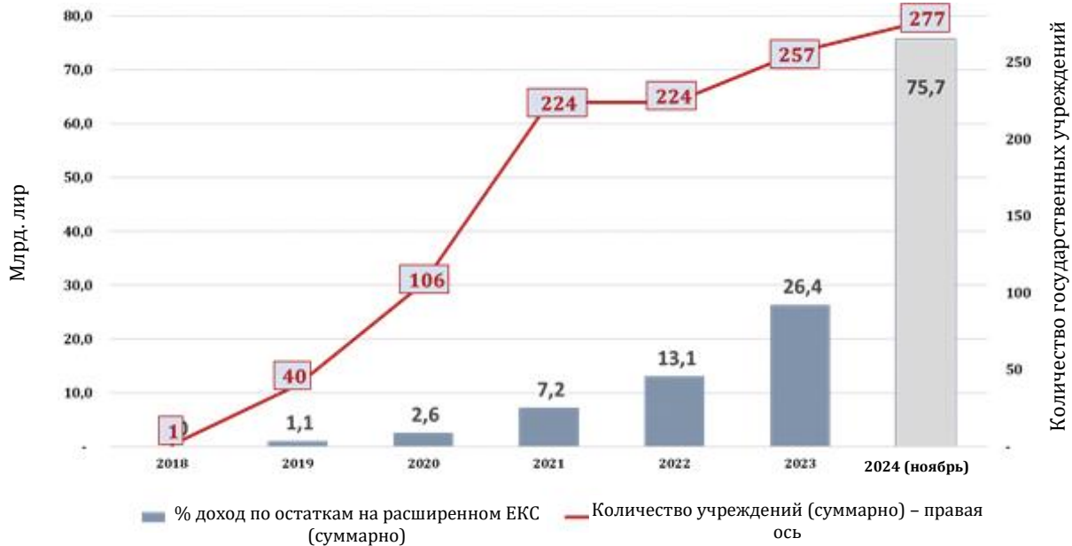
Рис. 1 – Расширение охвата ЕКС и процентный доход по остаткам средств на ЕКС в Турции в 2018-2024 годах