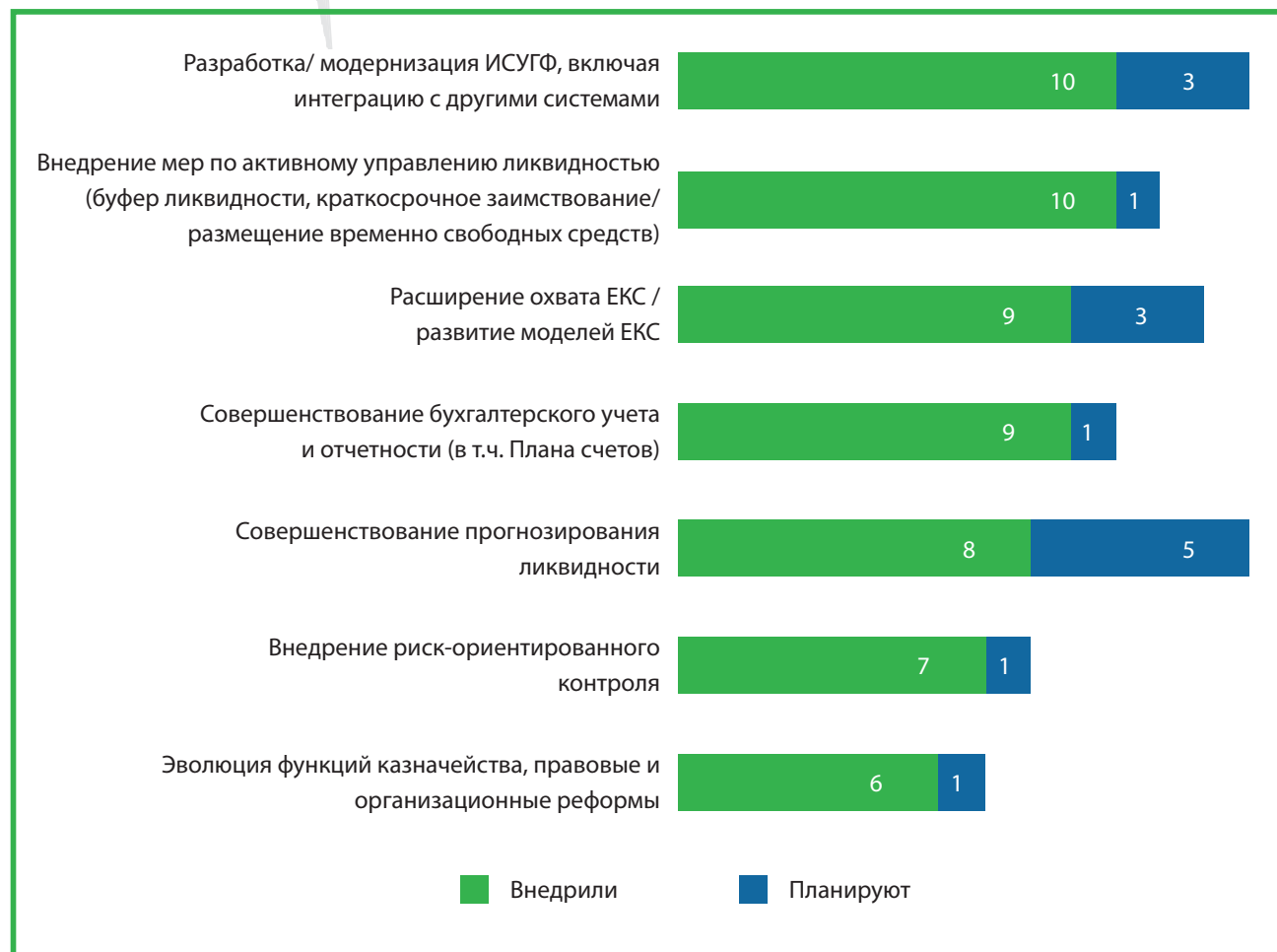
Рисунок 2. Страны, реализовавшие (планирующие) реформы в сфере деятельности казначейства на основе знаний, полученных благодаря РЕМПАЛ (число стран)