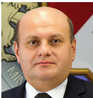
Nodar Khaduri gruzijski ministar financija

"Gruzija iznimno cijeni aktivnosti PEMPAL-a. Moja je zemlja imala koristi od izravnog sudjelovanja u ovom programu."