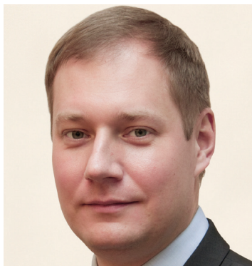
Roman Artyukhin voditelj riznice Ruske Federacije

"Kao jedan od sudionika prvog skupa TCOP-a koji je održan 2006. godine, kao i nekoliko nedavno održanih skupova, impresioniran sam očitim napretkom PEMPAL-a u stvaranju i ponudi proizvoda znanja i prilika za razmjenu iskustava među članovima. Drago mi je što mogu primijetiti sve veću ulogu samih članova TCOP-a u pripremi sadržaja skupa. Zemlje članice PEMPAL-a pridonose znanju o PFM-u i same se njime služe, što doprinosi efikasnosti mreže i učenju od kolega."