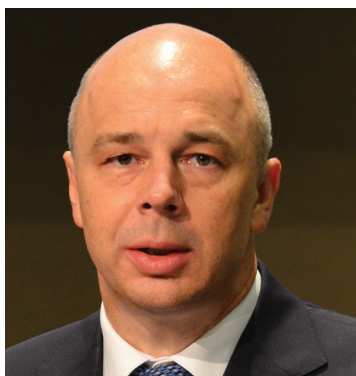
Anton Siluanov Ministar financija Ruske Federacije

i poznavateljima prakse diljem regije kako bi stvorila skupinu stručnjaka od kojih može zatražiti savjet i podršku za svoj program reformi. Osim toga, voditelj je nekoliko radnih skupina i redovito dijeli svoje pristupe i stručnost s PEMPAL-om, a ugostila je i više sastanaka, uključujući veliki sastanak svih zajednica prakse na temu fiskalne transparentnosti i odgovornosti koji je održan u Moskvi 2014.