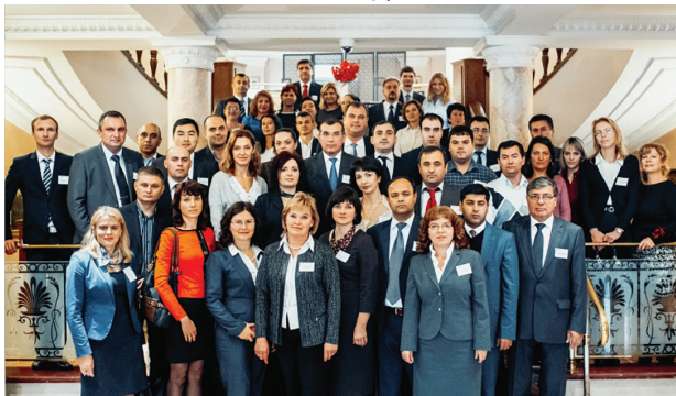
Заседание тематической группы в Минске, 2014г.

Во время мероприятия группа предоставила свои комментарии и рекомендации к проекту «Концепции новой ИСУГФ Республики Беларусь».