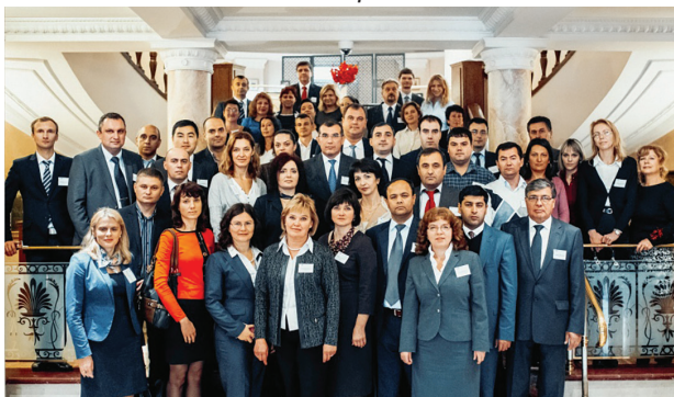
Sastanak tematske skupine u Minsku 2014.