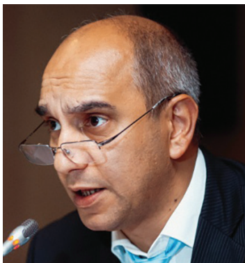
Nazim Kasum-zade voditelj Odjela za IT pri Agenciji za javnu riznicu Azerbajdžana