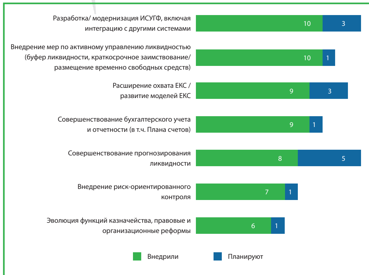
Рисунок 2. Страны, реализовавшие (планирующие) реформы в сфере деятельности казначейства на основе знаний, полученных благодаря РЕМПАЛ (число стран)